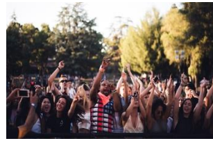
Menge - jubeln