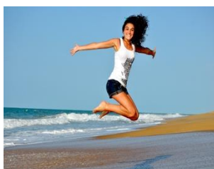
Frau - springen