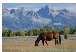
Pferd - grasen