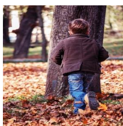
Kind – rennen