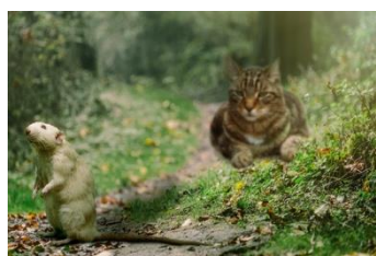
Kater – jagen