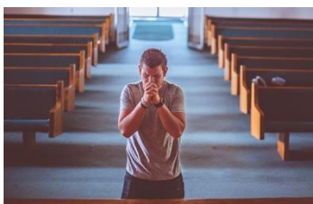
Mann – beten