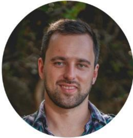
Jan Richter for

This Ebook was created in cooperation with Claudia from MyGermanAcademy.