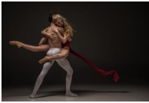
Paar - tanzen